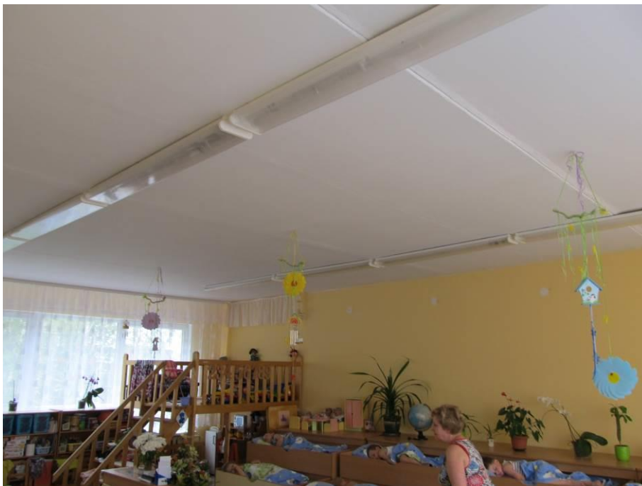
4.att. Ēkas apgaismojumam izmanto luminiscētas spuldzes