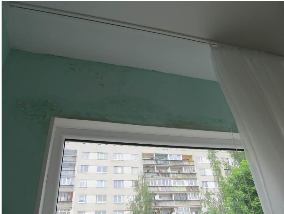
5.att. Konstatētas dažas vietas ar noplūdes pazīmēm.