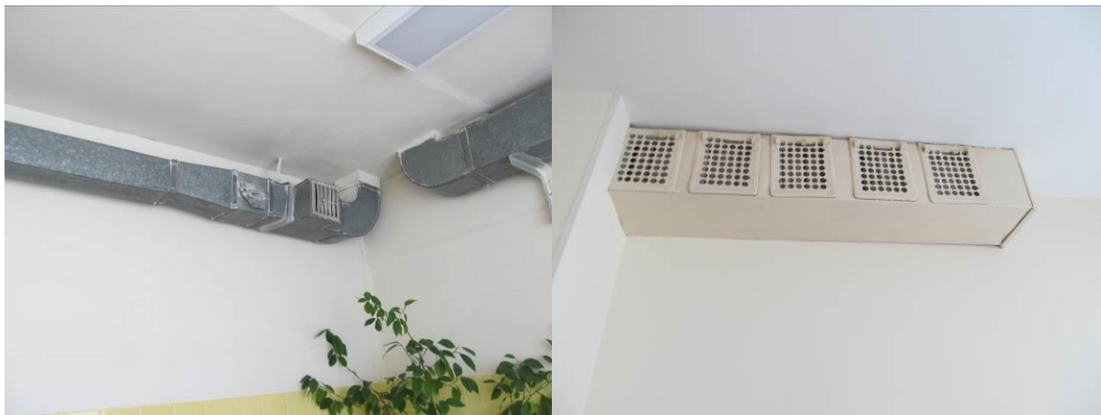
6.att. Ēkā izmanto gan mehānisko (virtuvē, mazgātavā) gan dabisko ventilāciju. Ventilācijas tehniskais stāvoklis ir slikts, tas gandrīz nefunkcionē.