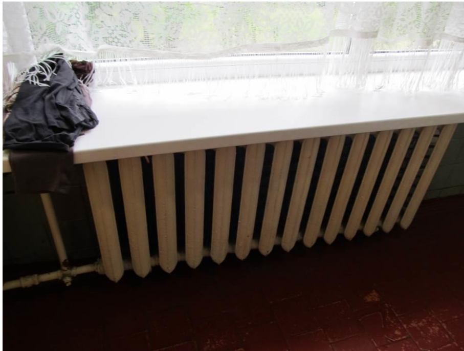
7.att. Apkuri ēkā nodrošina vecie radiatori. Tie ir novecojuši un ieteicams tos nomainīt