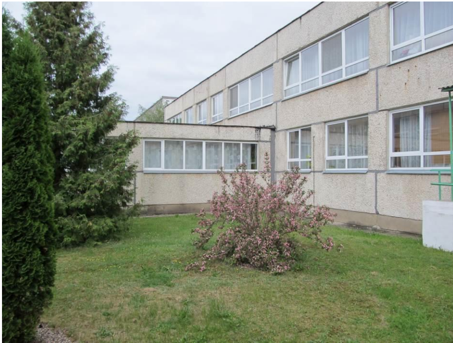
3.att. Ēkas fasādes ārsienas daļa. Visi ēkas logi ir nomainīti pret jauniem pakešu logiem PVC rāmjos. To stāvoklis vērtējams kā labs